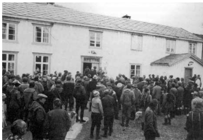
FKF blir ansvarshavende for Norgesmesterskap, Kongepokaløp, Norsk Derby, Høyfjellspokaløp og disponerer ellers Kongsvold-Hjerkinn-terrengene etter NKK. Her på tunet på Kongsvold under oppropet.

Fra starten av var det på det rene at en viktig funksjon for FKF ville være å arrangere dommermøter og konferanser. Like så lite som klubbene kjente dommerne hverandre i 1965. De hadde ikke et felles forum der spørsmål av felles interesse regelmessig kunne bli satt under debatt. Dommerstanden omfattet meget sakkunnskap på en rekke områder som gjaldt såvel utstillinger som jaktprøver, og gjennom meningsutveksling på dommermøtene mente FKF's styre at man ved hensiktsmessig informasjon til klubbene kunne bevege seg i retning av et mer harmonisert syn på en lang rekke spørsmål. På bakgrunn av representative uttalelser fra dommerkonferansene ville det være mulig for FKF's klubber å etablere en mer enhetlig politikk på en rekke felter av sentral betydning for arbeidet med våre fuglehunder, og en mer ensartet vurdering ville kunne oppnås i bedømmelse og derigjennom av ulike avisspørsmål.