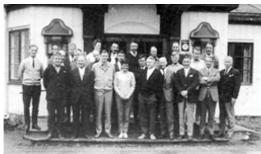
Et historisk bilde FKF's første dommerkurs 25.5-27.5.1970.

En ny situasjon var skapt ved dannelsen av FKF. Tidligere arbeidet fugle- hundklubbene stort sett på egenhånd uten noen sterk følelse av hvordan deres søsterklubber så på spørsmål og problemer som angikk dem alle. I særlig grad gjaldt dette for distriktsklubbene, som med den store geografiske avstand ikke hadde maktet å holde noen regelmessig kontakt med hverandre. Spesialklubbene var gunstigere stillet i så måte, men det var hovedsaklig på utstillingsområdet det var en viss organisert forbindelse mellom dem: så vel den årlige Fellesutstilling som "soneklubbmøtene" gjorde at man møttes regelmessig, men på et svært begrenset arbeidsområde. I prinsippet kunne man trygt si at spesialklubbene inntil 1965 arbeidet med sine respektive raser, distriktsklubbene innenfor sine begrensede, lokale geografiske områder.