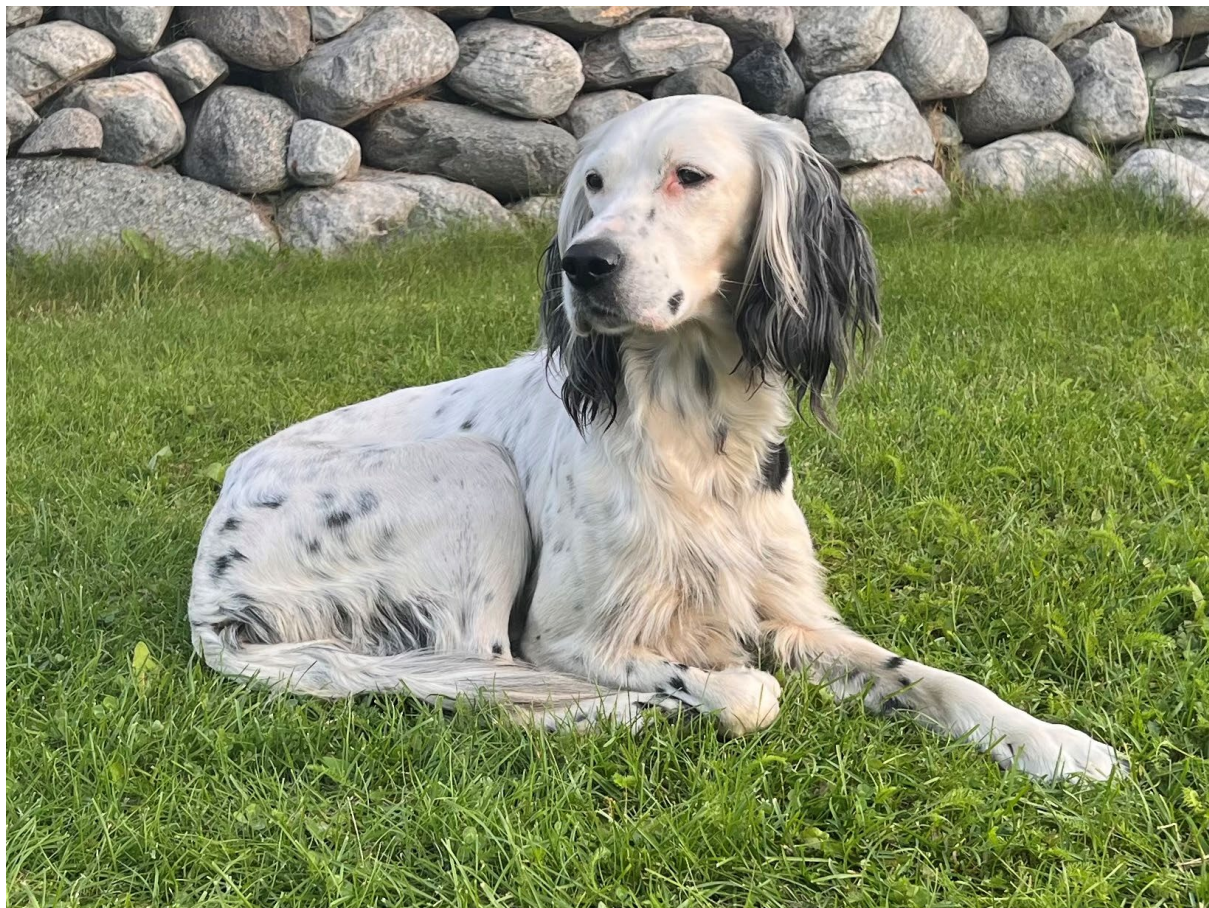
Vinner NM Skog 2025 Ferdesmyras C Anna Bella