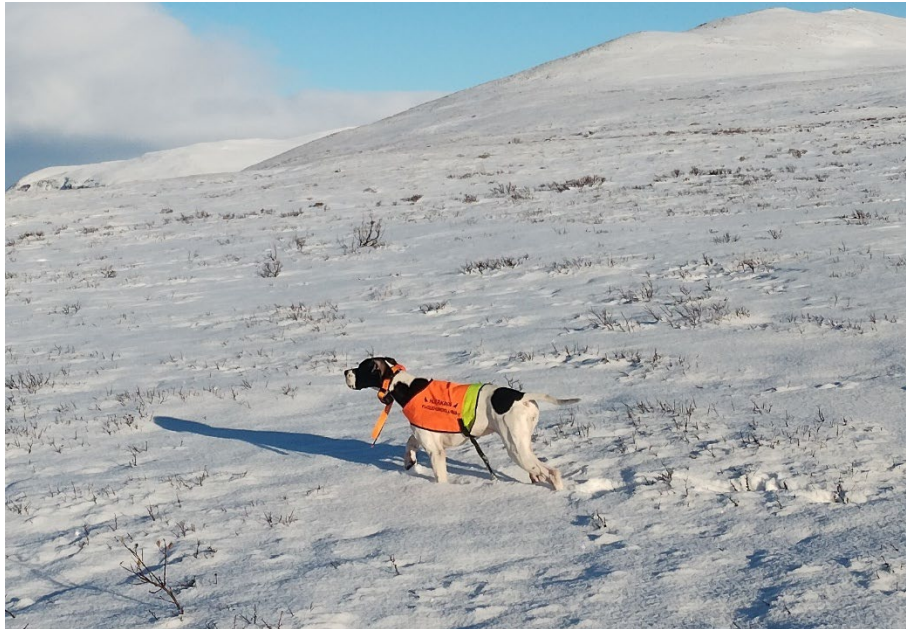
Vinner Norsk Derby 2025, P Pointstaffs Hel-Vete